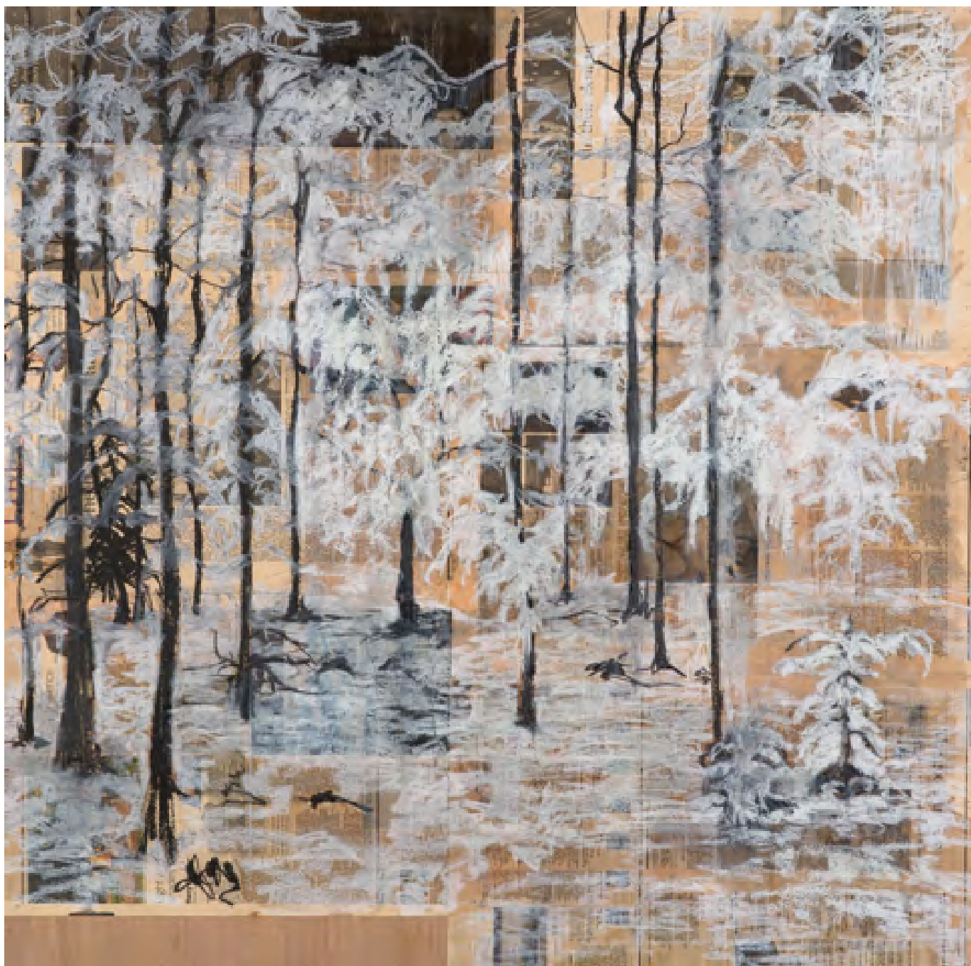
Sans titre, huile sur feuilles des journaux, contrecollé sur bois, 2012