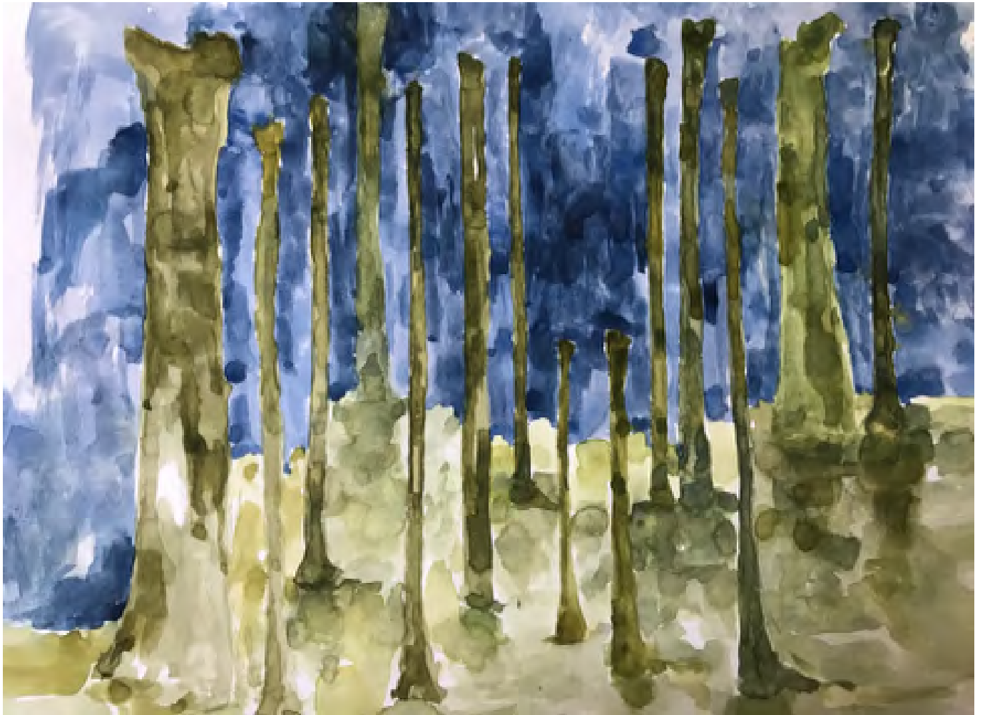
Sans titre, aquarelle sur papier, 2017