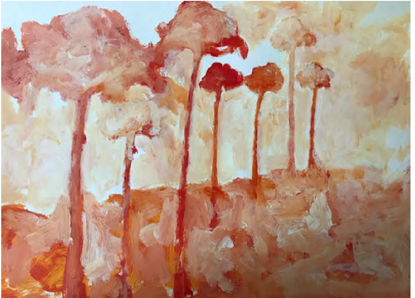
Sans titre, acrylique sur papier, 2017