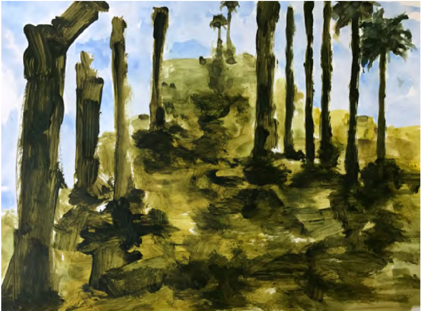
Sans titre, technique mixte sur papier, 2017