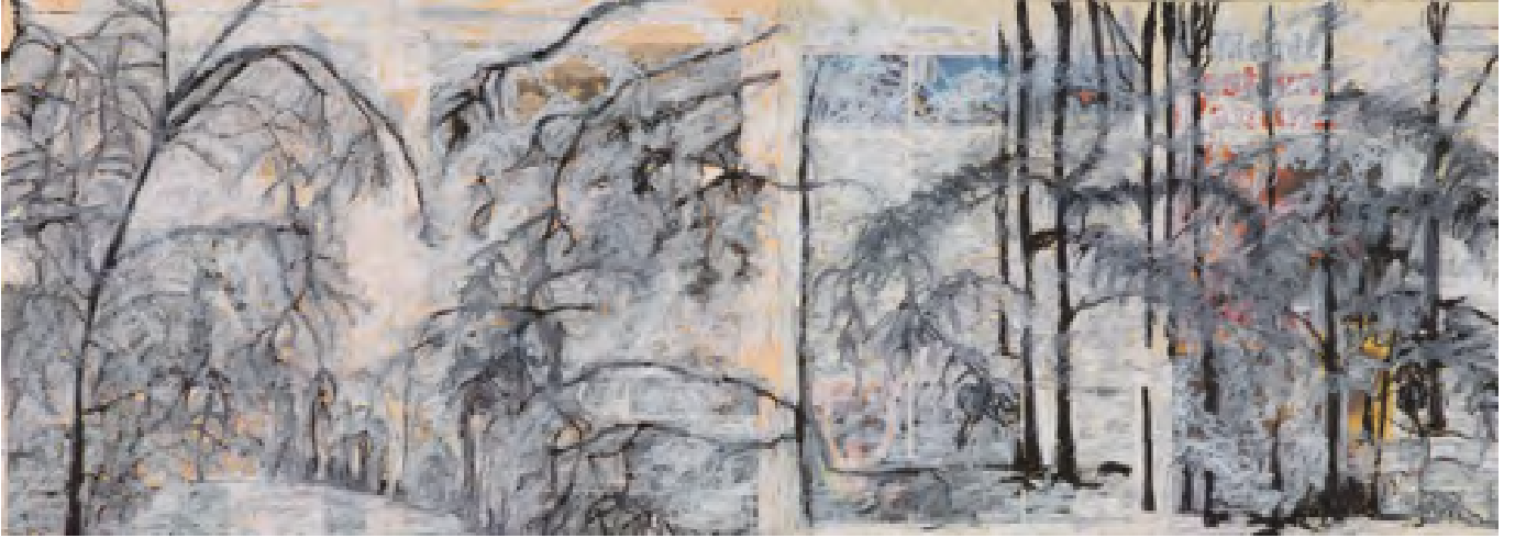
Sans titre, huile sur feuilles des journaux, contrecollé sur bois, 2011