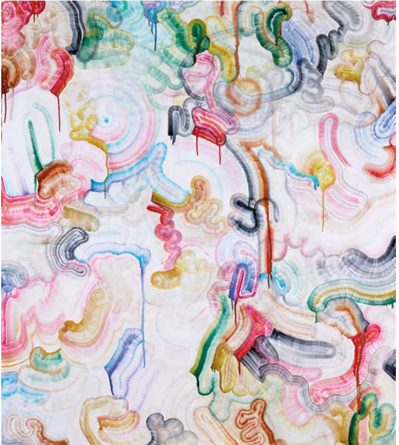
Untitled, Patricia Reinhart, aquarelle/feutre sur toile, 170 x 150 cm, 2019