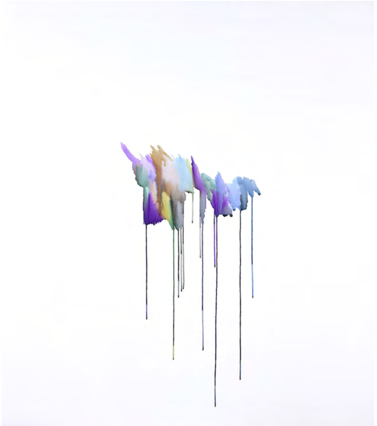
Untitled, Patricia Reinhart, aquarelle / feutre sur toile, 170 x 150 cm, 2018