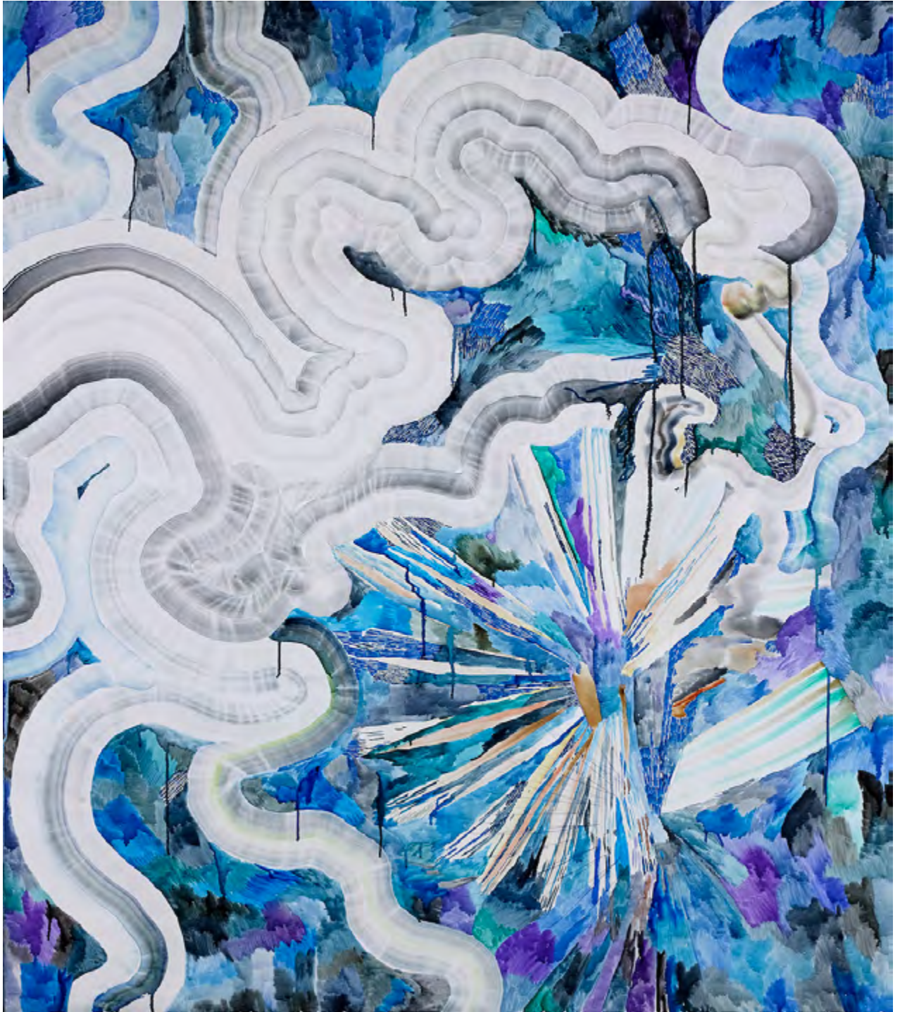
Untitled (Milky Way), Patricia Reinhart, aquarelle / feutre sur toile, 170 x 150 cm, 2018