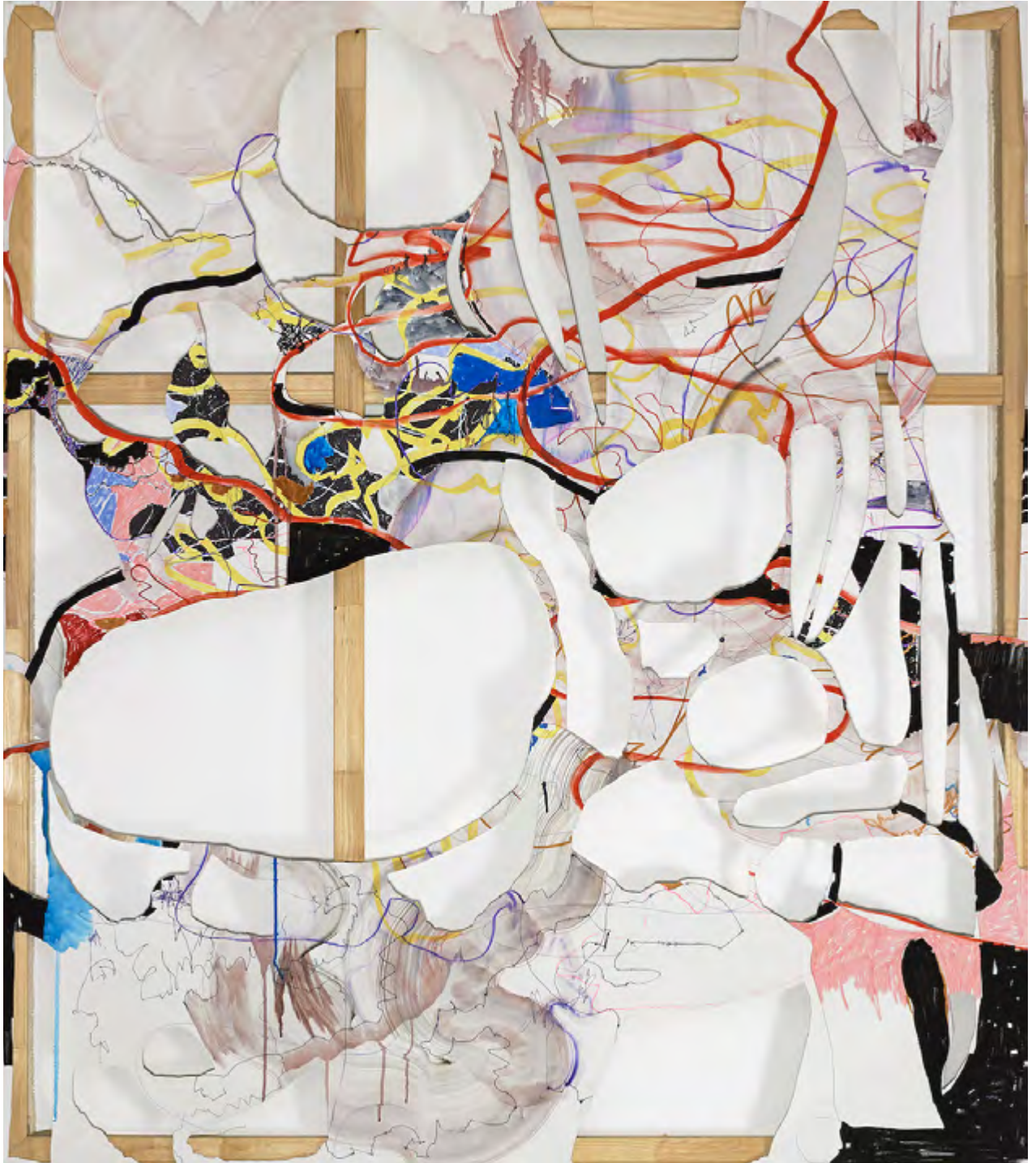
Cut Outs V, Patricia Reinhart aquarelle / acrylique / feutre sur toile, 170 x 150 cm, 2017