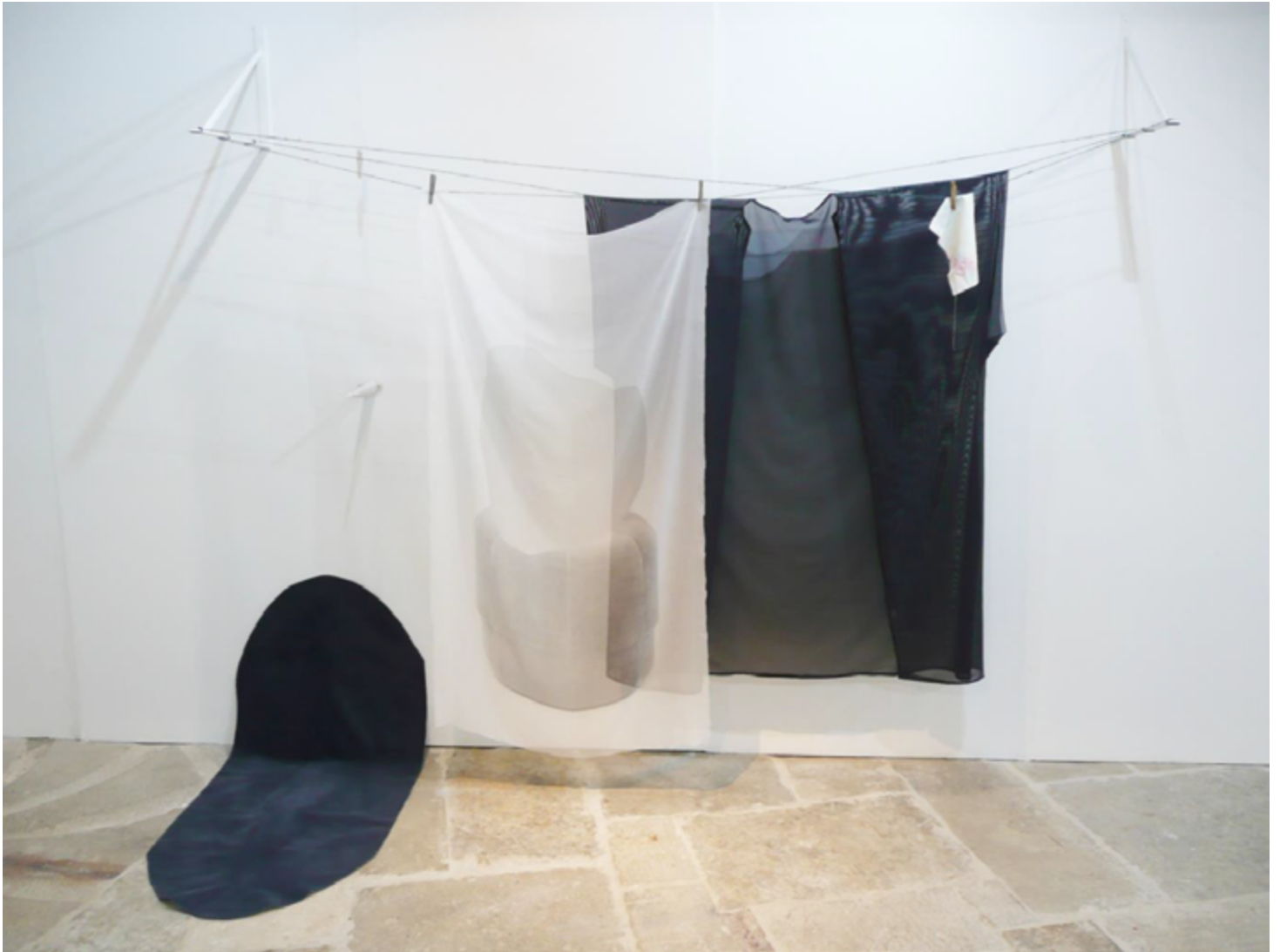
Peinture « Paysage » 2016, installation

Composées d'éléments hétéroclites mêlant parfois volumes sculptés et étoffes teintées, ces installations mettent en jeu l'absence de hiérarchie, la décontextualisation, la malléabilité, les déplacements. Ce sont ces caractéristiques qui permettent à l'indéterminisme et la réversibilité d'en réactiver les potentialités.