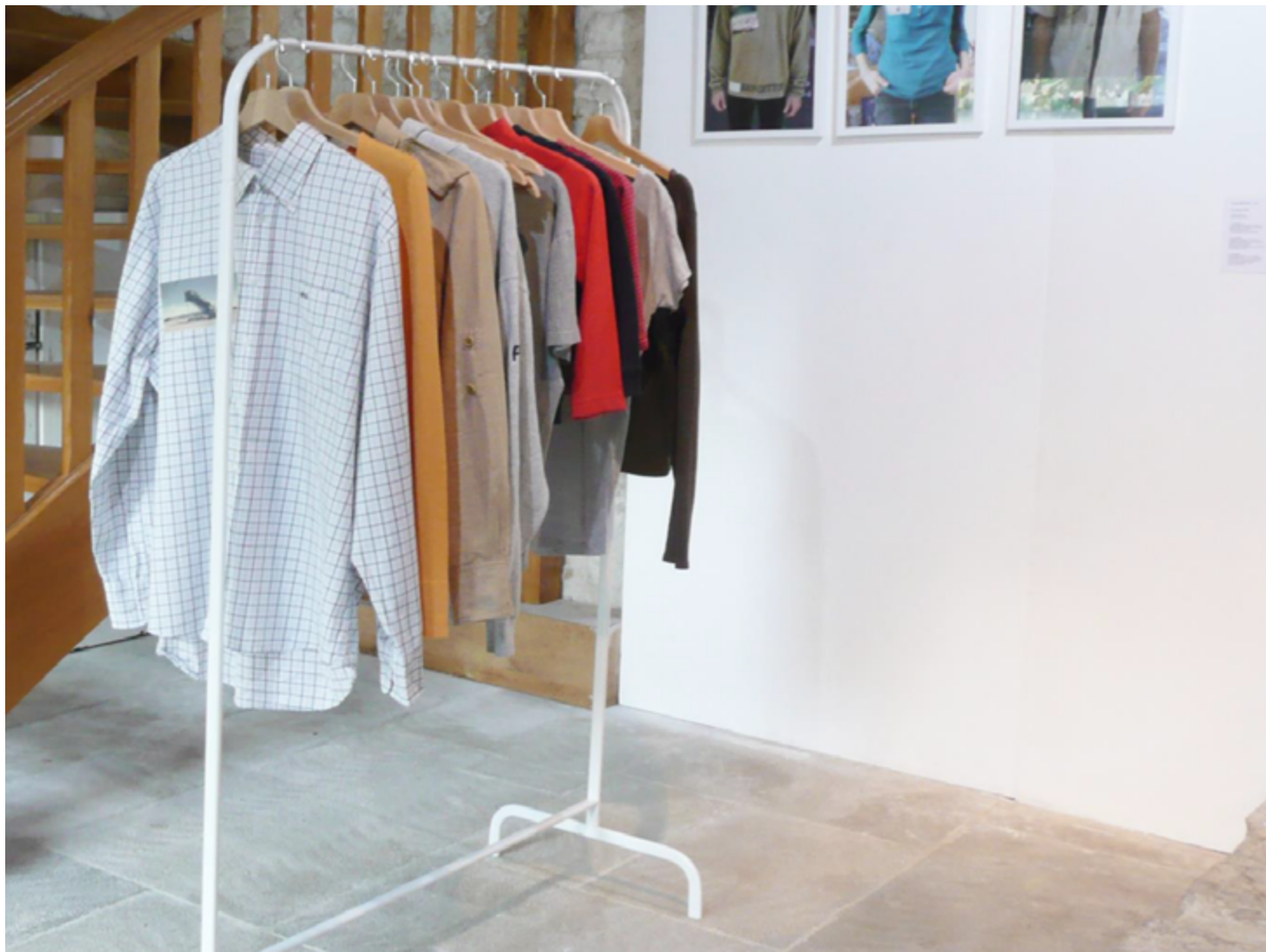
En Chemin , 2016, work in progress, impression sur vêtements de récupération