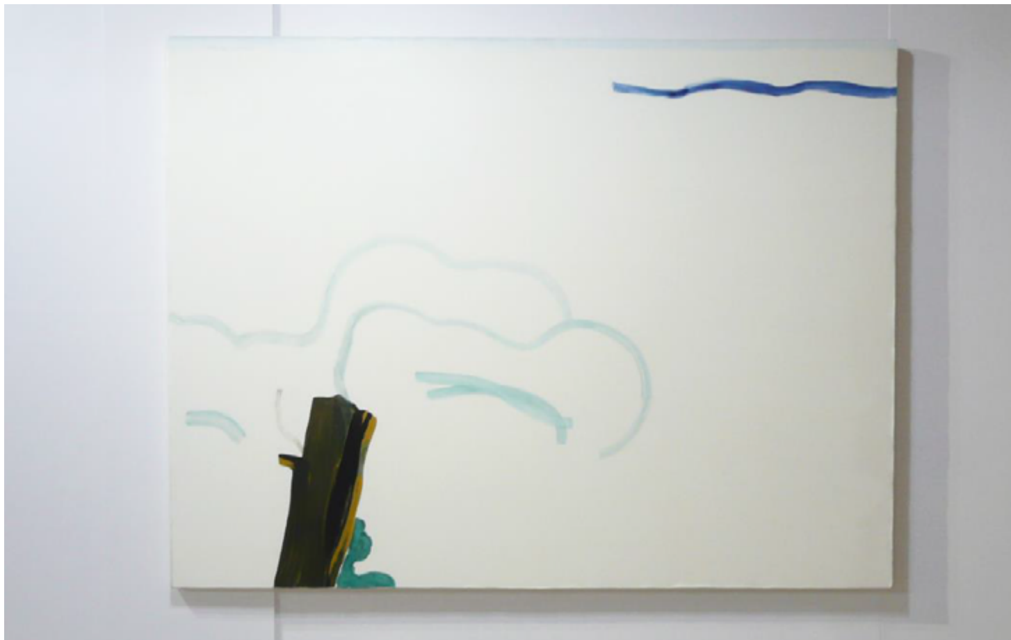
Paysage , 2016, acrylique sur toile

Une tentative d'élaboration d'un nouveau vocabulaire pictural via une mise en relation des « choses-entre-elles », penser les probabilités, les rencontres, comme hypothèse d'un nouveau langage en devenir. La surface de la toile deviendrait une aire de déposition de possibles en attente.