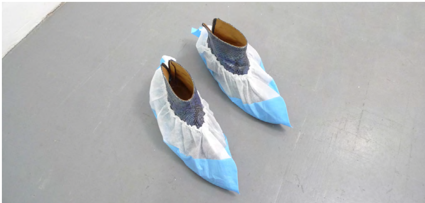
Couvre-chaussures, 2018 Chaussures, couvre-chaussures