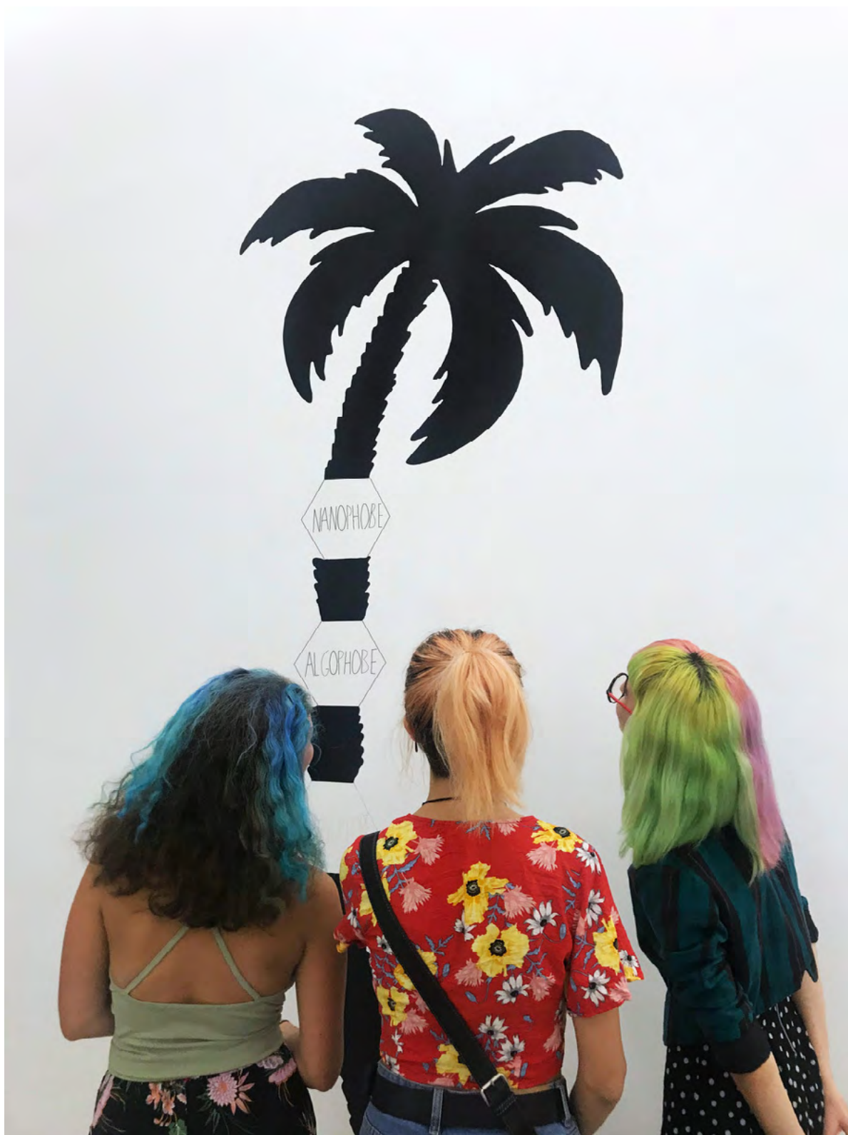
Arbre généalogique, 2018, Wall painting