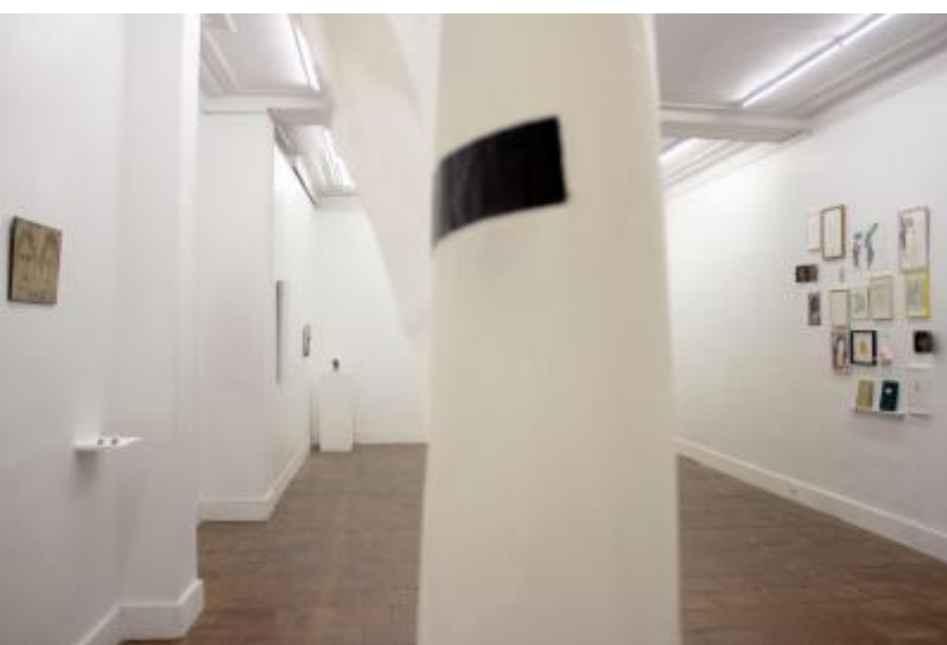
Vue de l'exposition.